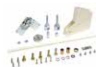
Knikmastset - max. hoogte plafond 3 m (alleen voor standaard rechthoekige masten)