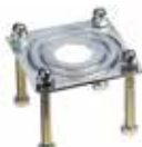
Steunplaat voor vorkvoet