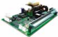
Elektronische motorsturing 624BLD (ingebouwd)