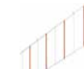
Kit schaarhek lengte 2 m ♦