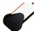
Masthouder rechthoekige mast ♦