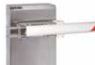
Masthouder voor ronde draaiende mast - (RVS)

In combinatie met de ronde draaiende masten is het niet mogelijk om hekken, plooivoet en vorkvoet te gebruiken.